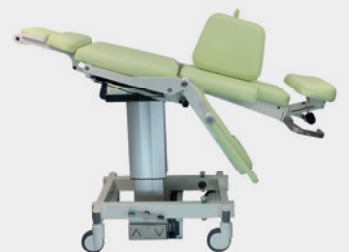
Schockposition Shock position