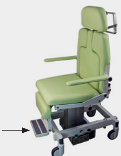
Ausklappbare Fußstütze Fold out foot support