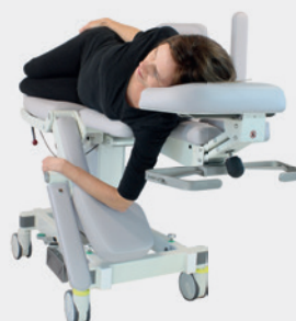
Biopsie Position Biopsy position